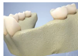
Volume osseux faible

Pour que cette période de cicatrisation se déroule dans les meilleures conditions, une prescription et des conseils post-opératoires, à suivre « à la lettre », vous sont remis par votre praticien.