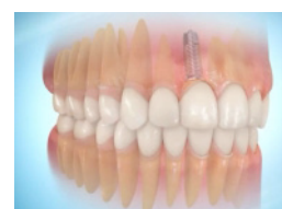
Prothèse dentaire terminée