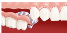
Insertion de la prothèse à châssis métallique