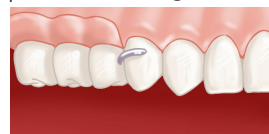
Prothèse en place

préparées pour stabiliser l'appareil, voire couronnées si elles sont fragiles.